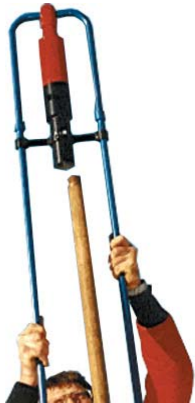
Pfahl- und Pfostenrammen

Druckluftspaten Turbo-Digger - mühelos graben mit Druckluftunterstützung