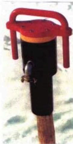
Pfahlramme PR 40 mit fahrbarer Hebehilfe "Drive" zum sicheren und ergonomischen Einrammen von großen Baumpfählen