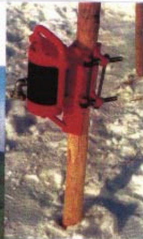
Pfahltreiber PRP 35 S parallel fixierter Pfahltreiber für grössere Pfosten