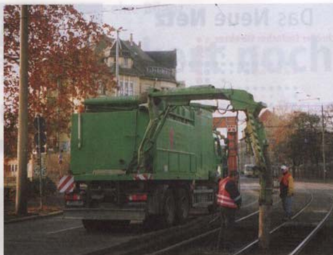
Der Saugbagger bei Reinigungsarbeiten in der Jahnallee am 4. Dezember. Der Schwenkarm kann schnell zur Seite gedreht werden, um den Linienverkehr nicht zu behindern.

Der Lastkraftwagen, auf welchem das Saugaggregat montiert ist, steht dabei auf der Straße neben dem Gleis. Der Tragarm mit dem Saugrüssel wird über die Schienen geschwenkt, dadurch entfällt eine Streckensperrung. Aufgesaugt werden die o. a. Partikel (Feinbestandteile) sowie, soweit vorhanden, auch der genannte Unrat. Bearbeitet wird dabei der unverdichtete Bereich des Oberbaues bis in eine Tiefe von etwa 15 Zentimetern. Bei Bedarf wird mit dem Ende des Saugrohres der Schotter etwas gelockert. Sollten dabei ein paar Steine aufgenommen werden, kommen sie wieder an ihren Platz zurück. Die Saugkraft ist einstellbar, so dass der lockere Schotter auch gänzlich entnommen werden könnte. Gereinigt werden, je nach Grad der Verschmutzung, die ersten 10 bis 15 Meter in Gleismitte nach Einfahrt in den Schwellenabschnitt (bzw. etwa die selbe Strecke vor Ausfahrt) sowie der so genannte Hosenträgerbereich. Er bildet die Fläche zwischen Bordsteinkante der Fahrbahn und der nebenliegenden Schiene.