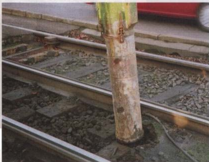
Hier sieht man deutlich den Unterschied: Rechts vor und links nach der Reinigung.

Angewendet wird es von der Firma Berliner Saugbagger Betriebe (BSB). Im LVB-Gleisnetz geschah das erstmals zwischen dem 1. und dem 16. November dieses Jahres in der Prager Straße zwischen Schönbachstraße und Sacke-Klinik.