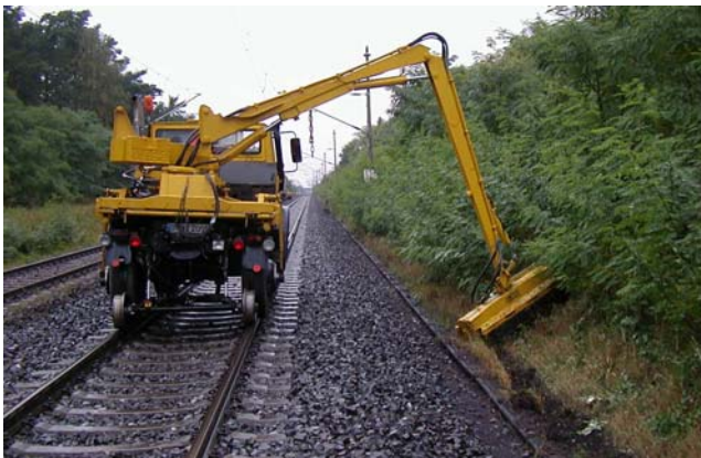
Böschungsmähen / Profilschnitt