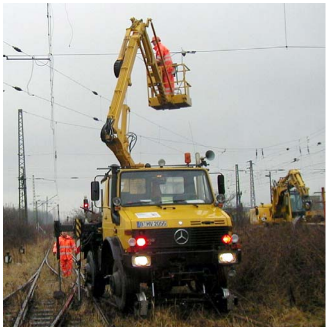
Arbeitsbühne (1000 V)

Dienstleistungen für Straßenbahn-Betriebe