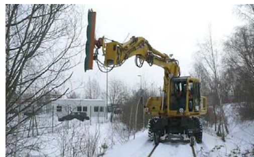
Atlas mit 4-fach-Säge

Video unter: http://youtu.be/n9r1Bs2-L-8