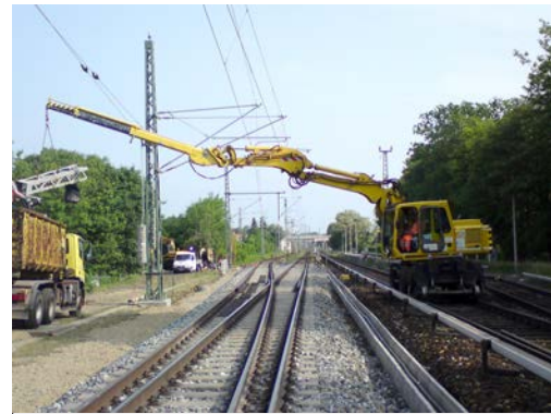
Armverlängerung „AV2“ bis 13 m