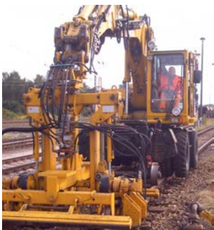
Atlas mit Stopfgerät AST8

Video unter: http://youtu.be/hBS21Zvw4no