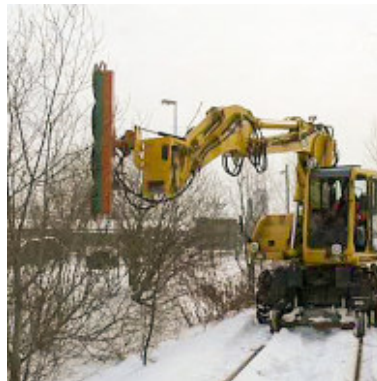
4-fach Säge „Mulag“

Gewicht: 1.036 kg Breite: 1,20 m - Länge: 0,87 m - Höhe: 1,15 m