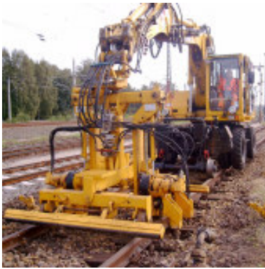
AST8 - Stopfgerät

Gew.: 1,5 t - Breite: 2,13 m - Tiefe: 1,60 m - Höhe: 1,65 m (Transportmaße)