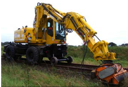
Atlas mit Forstmulcher

Video unter: http://youtu.be/hBS21Zvw4no