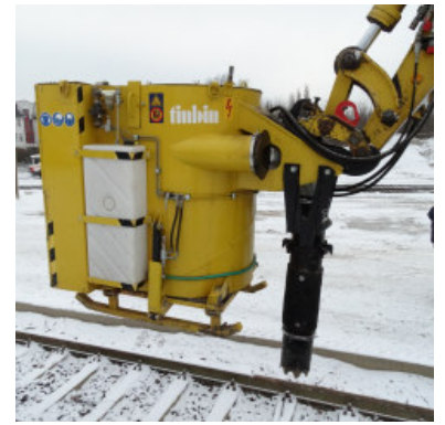
Anbausauger tinbin TC2

Nutzlast: 8 t - Eigengewicht: 4,9 t - Breite: 2,56 m - Länge: 4,80 m - Höhe: 1,05 m bzw. 1,45 m