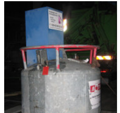
Tankbombe 999 Liter

Gewicht: 415 kg Breite: 1,50 m - Länge: 2,10 m - Höhe: 1,10 m