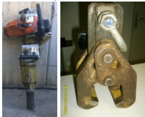
Kleingeräte: Schienenzange, Stopfgeräte, Schwellenschraubmaschine, Steinsäge, Kettensäge, etc.

Gewicht: 695 kg Breite: 0,90 m - Länge: 1,00 m - Höhe: 1,28 m