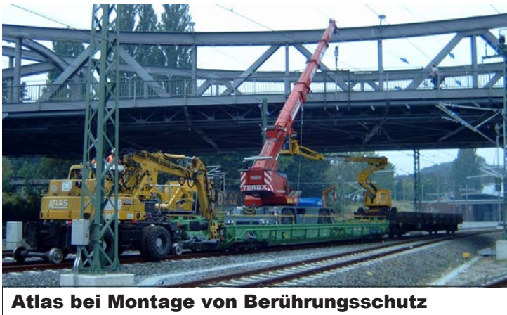
Atlas bei Montage von Berührungsschutz