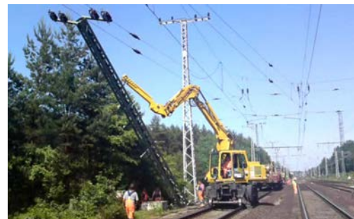
Montage/Demontage von Masten mit Armverlängerung

Video unter: http://youtu.be/n9r1Bs2-L-8