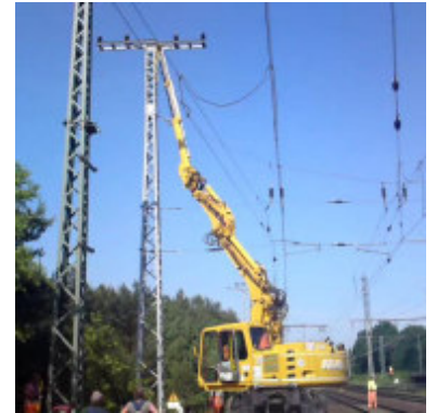
Armverlängerung AV2 (13m)

Gewicht: 1,15 t Breite: 2,80 m - Tiefe: 1,57 m - Höhe: 1,35 m