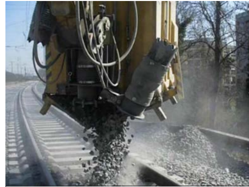
Entleerung des Anbausaugers TC1