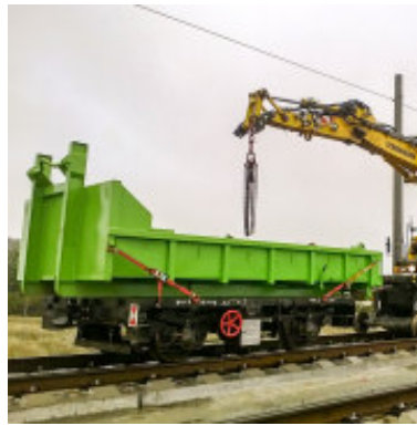
SKL-Anhänger AF 108

Gew.: 1,5 t - Breite: 2,13 m - Tiefe: 1,60 m - Höhe: 1,65 m (Transportmaße)