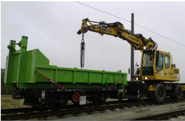
Zweiwegebagger Liebherr A900 mit SKL-Hänger

Video unter: http://youtu.be/o8SviSaSwuE