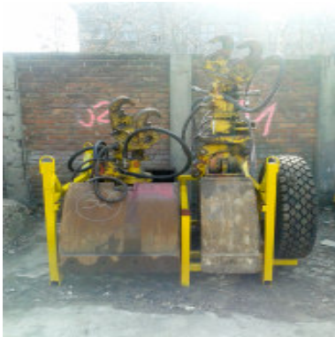
Diverse Greifer, Anschlagmittel, Lasthaken, Grabenräumer, Tieflöffel (SFG, 30er, 40er, 60er, 80er)

Gewicht: 1,0 t Breite: 1,41 m - Länge: 2,19 m - Höhe: 1,65 m