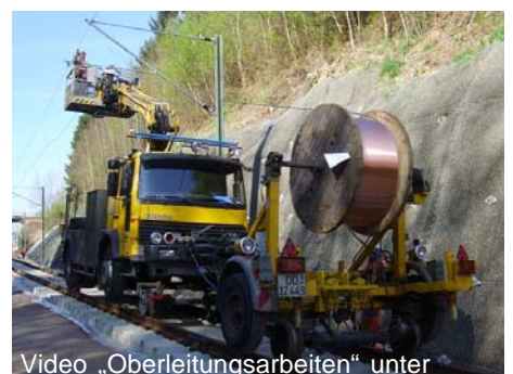
Video „Oberleitungsarbeiten“ unter http://youtu.be/UBhXGkXpbro