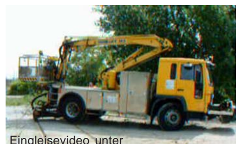
Eingleisevideo unter http://youtu.be/j9DuZmVatp4