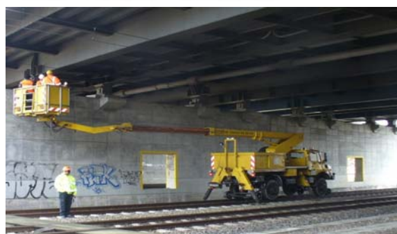
Video „Die Brückenprüferin“ unter http://youtu.be/jV4MvK4NFB4