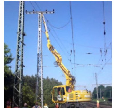
Armverlängerung AV2 (13m)

Gewicht: 1,15 t Breite: 2,80 m - Tiefe: 1,57 m - Höhe: 1,35 m