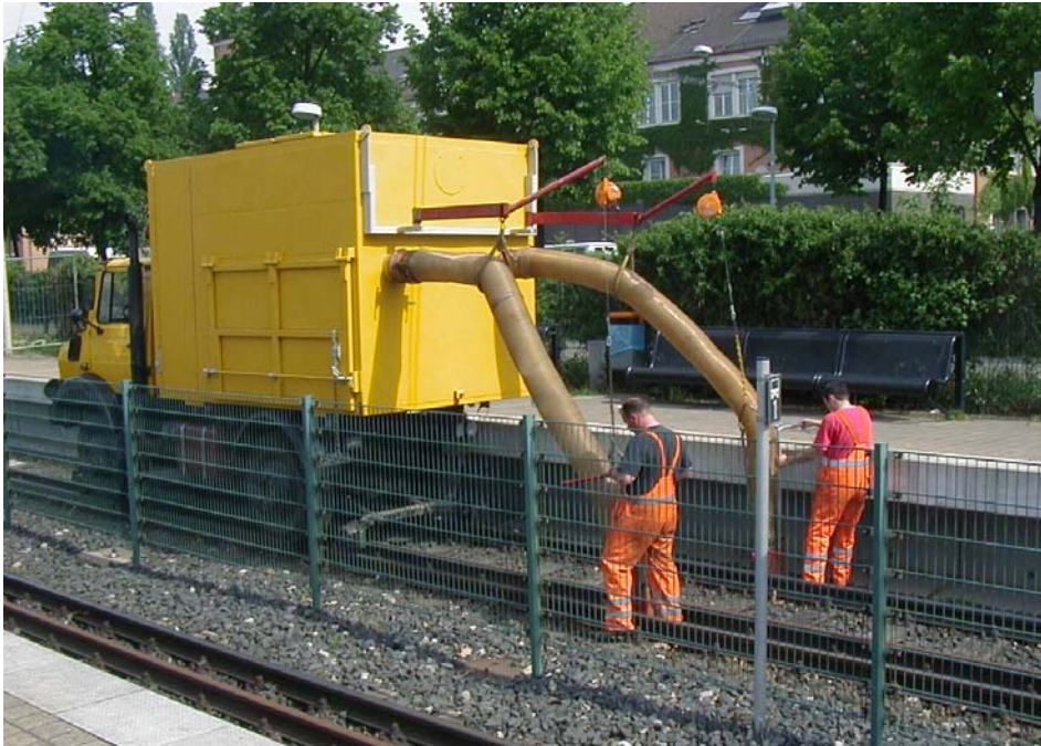
Video „in-situ-Schotterreinigung“ unter http://youtu.be/d4LDtyjK_aQ

Eingleisen: am höhengleichen Überweg (BÜ) = http://youtu.be/BBAWZxxXfsE