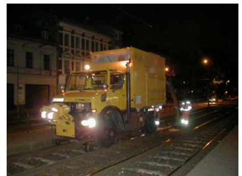
Video „Gleisreinigung bei KVB (Köln)“ unter http://youtu.be/BBAWZxxXfsE