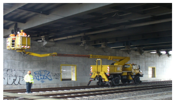
Video „Die Brückenprüferin“ unter http://youtu.be/jV4MvK4NFB4