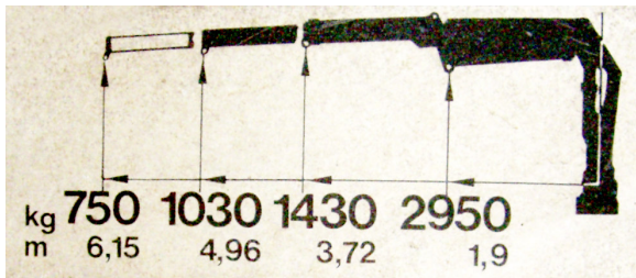
Last- und Reichweitendiagramm „AK 3006 DB“